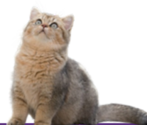
BRITISH SHORTHAIIR PKD + FOLD