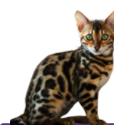
BENGAL APRb + PKDef