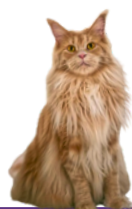
MAINE COON PKDef + SMA + HCMC + GS (ADN)

Détails des maladies génétiques selon la race (plus d'informations au verso)