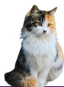
NORVÉGIEN PKDef + GSD4 + GS (ADN)